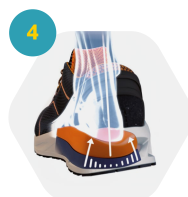
4 Stabilisation du pied