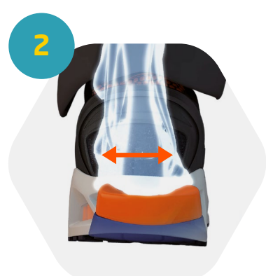
2 Dissipation de l'énergie