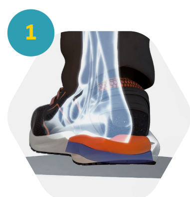
1 Amortissement des mouvements

Les K-POP sont conçues pour garantir un confort dynamique, grâce au système breveté i-daptive® à géométrie variable, qui change de structure en fonction du travail et du type de terrain.